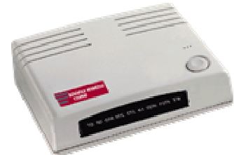
Réf : P048FWBX

Avec Numéris, le temps d'établissement d'une communication est de 3 secondes ce qui accélère considérablement la navigation sur le web, la messagerie Internet, et le transfert de fichiers. Mais avec son modem analogique intégré, il vous permet également d'envoyer des fax ou de vous connecter à des serveurs Minitel.